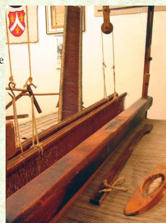
Webstuhl, Baujahr 1797